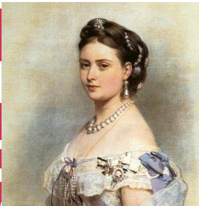
La Princesse de Clèves

Observons cette page extraite de La Princesse de Clèves de Madame de La Fayette.