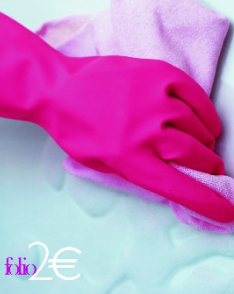
Gertrude Stein La brave Anna